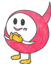
砥部町ボランティアセンター イメージキャラクター「とべと」