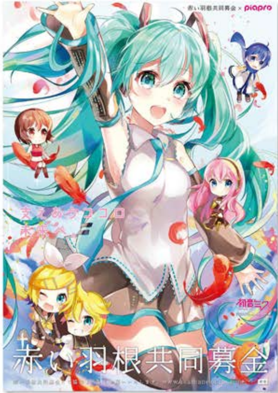
illustration by つかさ

©Crypton Future Media,INC. www.piapro.net piapro