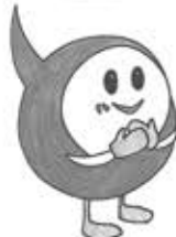
砥部町ボランティアセンター イメージキャラクター 「とべと」