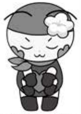
砥部町社会福祉協議会 イメージキャラクター 「ホッと君」

この思いを大切に、今後も「地域福祉学習」「地域共生」について、皆様と一緒に考え、取り組んでいきたいと思えます。