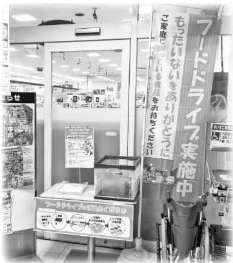
セブンスター砥部店 フードドライブ設置コーナー