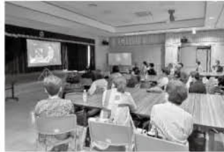
子育てや町づくりについてDVDを鑑賞