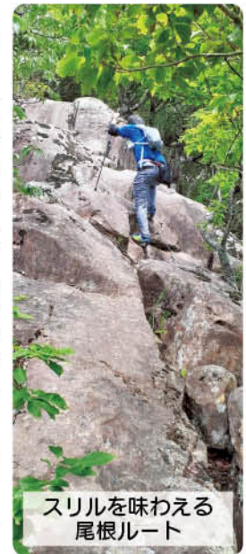
スリルを味わえる 尾根ルート

中でも、この時期は、「イチヤクソウ」「ソヨゴ」「イボタノキ」などを含む草木の花々が見事。 ※このコースは足場が悪いポイントもあり、健脚の人向きです。興味ある人は十分装備を整え、注意して臨んでください。