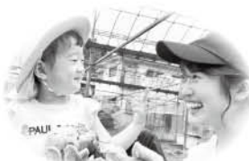
収穫をする親子の様子