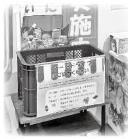
中央公民館 設置場所