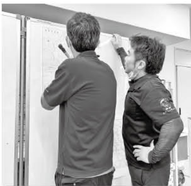
真剣に訓練に取り組む社協職員