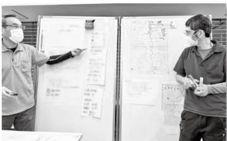
地図を見ながら情報収集