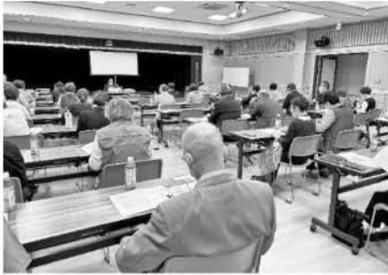
民生児童委員協議会 定例会