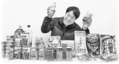
ご寄付頂いた食品

株式会社セブンスター砥部店で、新たな試みとしてフードドライブコーナーが設置されました。初日からたくさんの方にご寄付を頂きました。ご寄付頂いた食品は砥部町内の食にお困りのご家庭や子ども食堂へ提供させて頂きます。皆様のご協力をお願いします。もったいないをありがたうへ繋げるフードドライブの活動がより一層広がっていければ良いなと思っております。