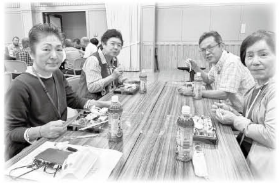
広田地区の民生児童委員

昨年12月に民生児童委員の改選が行われ、約3分の2の委員が新任委員へ変わりました。半年がたち、委員同士で交流を深めたり、地域の事をもっと知ろうという活動が再開してきています。そんな中で、6月8日(木)に3年ぶりに広田地区での交流会が行われました。広田交流センターで定例会を行ったあと、「砥部町山村留学センター」を視察しました。砥部町に住んでいても広田を訪ねることはあまりないという委員もあり、広田地区を知る良い機会となりました。