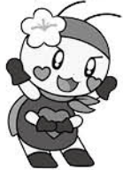
砥部町社会福祉協議会イメージキャラクター「ホッと君」