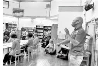
砥部町山村留学センター視察