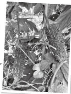
みどりのらくえん ～ Oh!はたけ～のゴーヤ