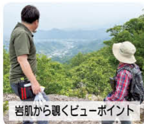
岩肌から覗くビューポイント