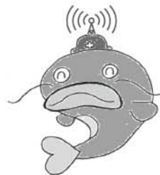
砥部町社会福祉協議会 防災キャラクター とべますくん

BCP(事業継続計画)とは… 大規模な災害や事故、感染症などにより被害を受け、重要な業務や福祉サービスの提供をなるべく中断させない、中断しても可能な限り早急に再開、継続するように事前に取り決めておく計画です。 5月28日(日)に、「中予地区地震 震度5強 警戒レベル3発令から警戒レベル5へ引きあがった」という想定のもと職員参集、情報収集、伝達から災害ボランティアセンター立ち上げまでの訓練を行いました。砥部町の地図も用意し、道路や家屋、ライフライン等の被害状況(想定)を書き込み、職員、サービス利用者、各団体さんの安否確認等各課でBCPを確認しながら、進めていきました。職員の参集、情報収集も比較的スムーズに行えましたが、訓練後、各担当では、反省点や修正する部分等を話し合い、どの職員でも対応ができるようにBCPの内容の見直しや追加をしながら、訓練を重ねていくことが大事だと感じました。同時に、自分たちの暮らしの中で備えることも考えていく良い機会となりました。