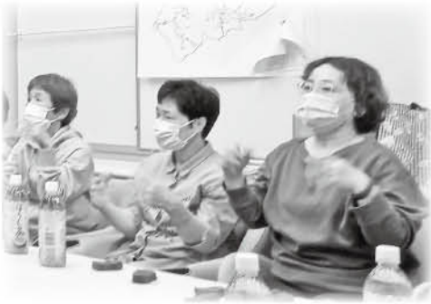
体操を楽しむサロンメンバー

昔はPTA活動などで地区の人に会うことがありましたが、歳を重ねてそのような機会も減り、1日お化粧もしないで家に閉じこもっているという話も耳にするようになっていきます。それでは寂しいなと思います。昭和30年、40年世代の人たちで気軽に集まれる場所を作りたいとの思いから立ち上げました。